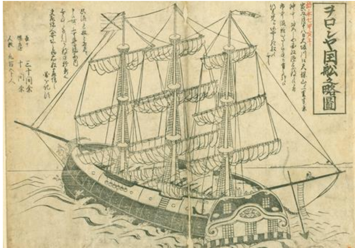
『ヲロシア国船之略圖』18--【寄別7-5-1-5】

ペリー来航と同じ1853年、ロシアのプチャーチンらが長崎に来航し、日本との条約締結を申し出た。