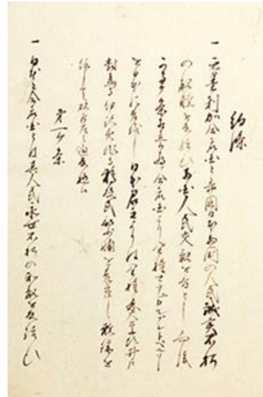
「日米和親条約写」【三条家文書3-49】 安政元(1854)

幕府は、広く大名たちに意見を聞いたが、開国への賛成と反対でまとまらないまま、1854年に再び来航したペリーの強い態度に押され、日米和親条約(にちべいわしんじょうやく)を結んだ。