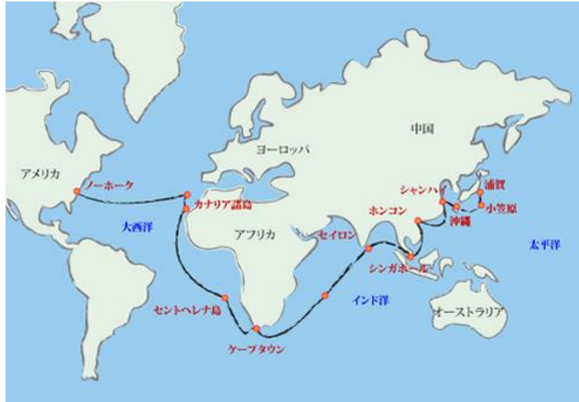
ペリー艦隊の航路

アメリカは、清(中国)との貿易や捕鯨(ほげい)の中継地として日本を開国させようと考えた。