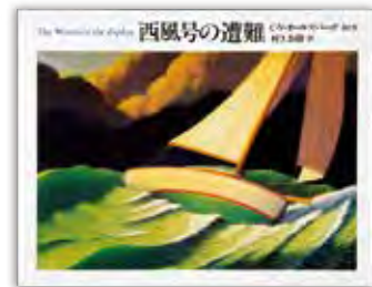
『西風号の遭難』 クリス・ヴァン・オールズバーク 絵と文 村上春樹 訳 河出書房新社 1985