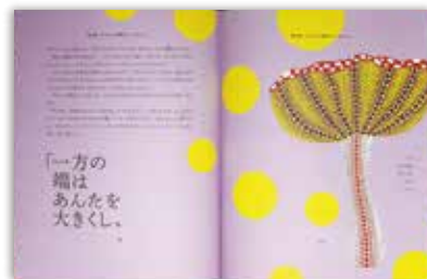
『不思議の国のアリス：With artwork by草間彌生』 ルイス・キャロル 作 楠本君恵 訳 草間彌生 挿画 グラフィック社 2013