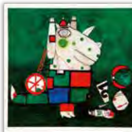
『ふしぎなきもの』 アネリース・シュヴァルト ぶん クヴィエタ・パツオウスカー エ いけうちおさむ やく ほるぶ出版 1990