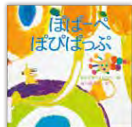
『ぼぼーべ ぼびぼっふ』 おかざきけんじろう 絵 谷川俊太郎 文 クレヨンハウス 2004