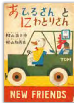
『あひるさんとにわとりさん』 村山篤子 作 村山知義 絵 ニューフレンド 1948

20世紀初頭に起こったダダやシュルレアリスムに始まり、第二次世界大戦を経て現代に至るまでの芸術思潮と絵本の関わりについて取り上げるほか、様々な画家によって描かれた「不思議の国のアリス」、「赤ずきん」、「ピノキオ」も展示します。皆様のご来場をお待ちしております。