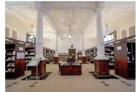
児童書ギャラリー

国際子ども図書館レンガ棟は1906(明治39)年に帝国図書館として作られた建物を、保存・改修して利用しています。児童書ギャラリーは帝国図書館時代の「特別閲覧室」で、館長が特別に認めた研究者が使っていました。書架以外は帝国図書館時代の状態を復元しています。漆喰で仕上げられた4本のオーダー(柱)が印象的な作りになっています。